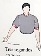
Tres segundos en zona

En la zona defensiva, los jugadores pueden estar solamente por tres segundos antes de que caiga el balón; si el jugador no sale en este tiempo, el juez le pita tres segundos en zona.