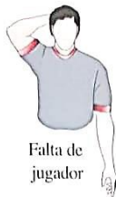
Falta de jugador

Esta señal indica que el jugador ha cometido una falta a un contrario, se acerca a la mesa de control y señala el número de la persona que cometió la falta.